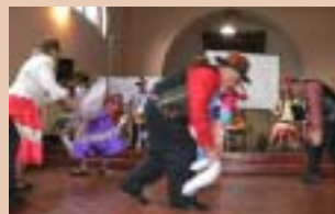
FIESTA DEL ENCUENTRO

“Si el sueño no nos permitiera Anticipar un mundo diferente; Si la esperanza no hiciera posible Esta capacidad un poco milagrosa, Que el ser humano tiene que clavar Los ojos más allá de la infamia, ¿Qué podríamos creer? ¿Qué podríamos esperar? ¿Qué podríamos amar? Porque en el fondo uno ama al mundo, A partir de la certeza de que este mundo, triste mundo Convertido en un campo de concentración, Contiene otro mundo posible. O sea que está embarazado de maravilla. En el fondo, el acto de vivir y luchar, A pesar de todo, Es un acto sagrado de locura.”